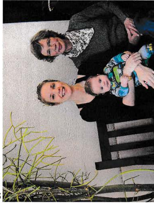
3 generationer til babysalmesang

For børn fra 6 år og deres familier Billetter sælges fra 19. marts 2011. på biblioteket eller kan reserveres på dyssegaardskirken@hotmail.com. Pris 30 kr. stk.