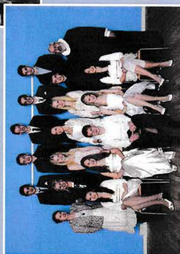
16. maj kl. 10.30