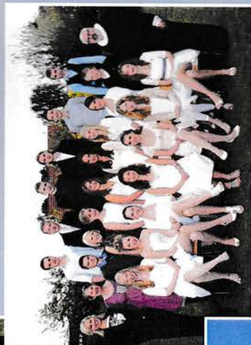
13. maj kl. 12.00