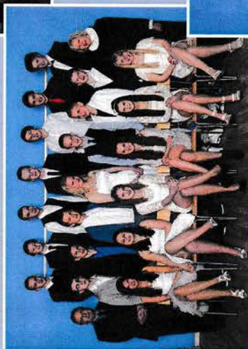
15. maj kl. 10.00