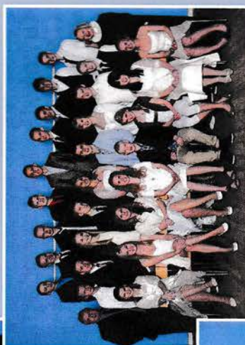
15. maj kl. 12.00