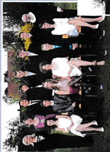
13. maj kl. 10.00