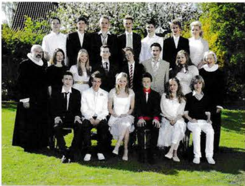
Lørdag den 5. maj kl. 10