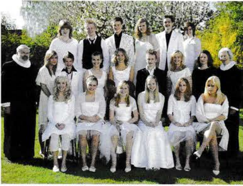
Bededag den 4. maj kl. 10