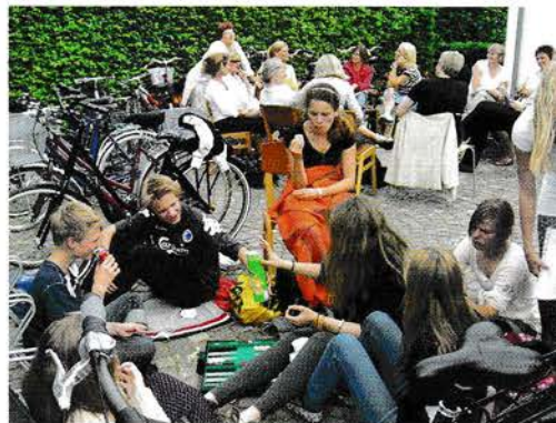
Tålmodige kommende konfirmander på indskrivningsdagen