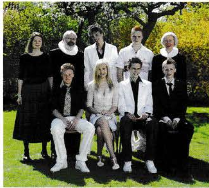
Lørdag den 5. maj kl. 12