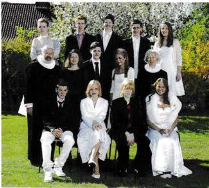
Søndag den 6. maj kl. 10.30