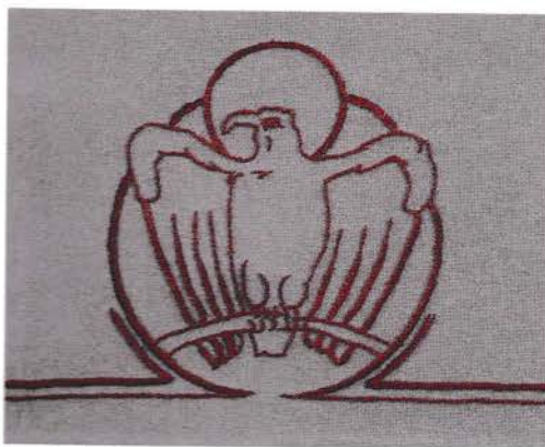
Ørn. Symbol for evangelisten Johannes.