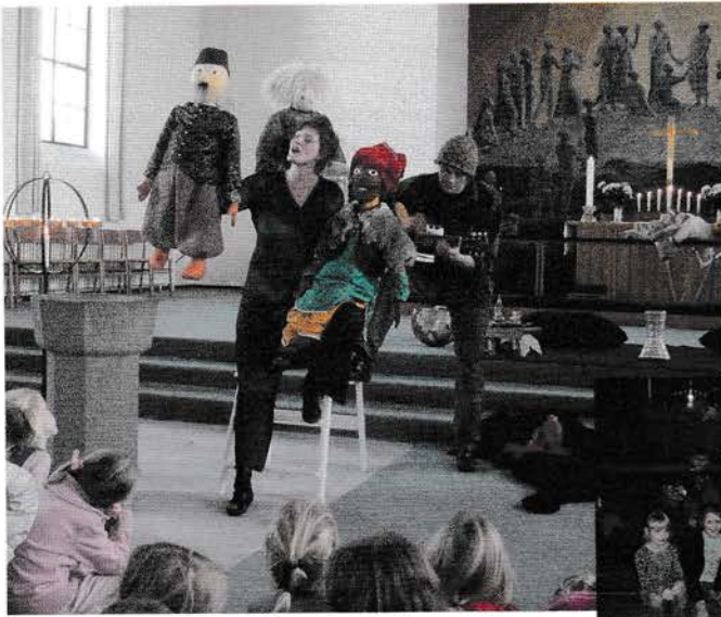
▲ Hellig Tre Kongers skuespil for sognets skolebørn i 2. klasse.