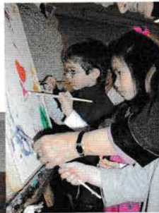
Julefest. ▶ Børn maler billede.