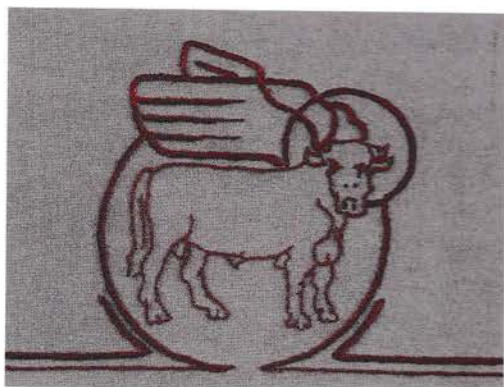
Okse. Symbol for evangelisten Lukas.

Søndag den 31. juli ( 10. s. e. trin. ) kl. 10.30 Vagn Frikke-Schmidt - Luk. 19, 41-48