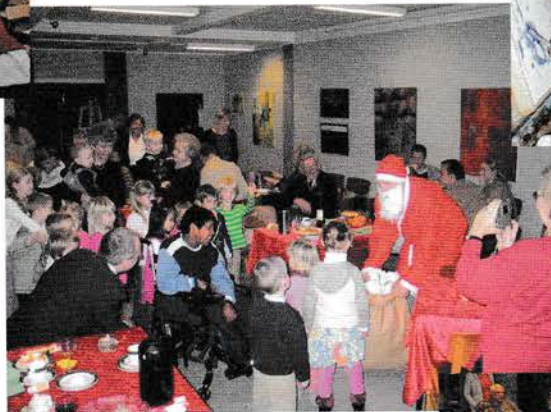
Julefest. Julemanden på besøg. ▶