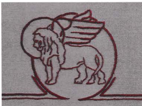
Løve. Symbol for evangelisten Markus.