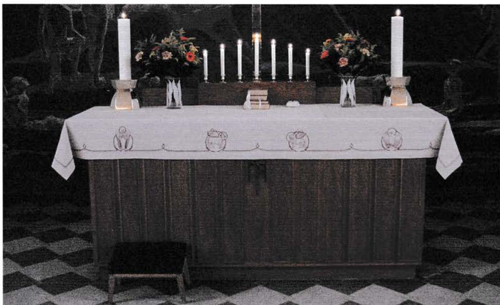
De fire symboler er vist i gudstjenestelisten.

"Herrens bord", "Det hellige bord" kaldte de første kristne det bord, hvor nadveren holdtes og udtrykte dermed, at dette bord var helligt frem for noget andet.