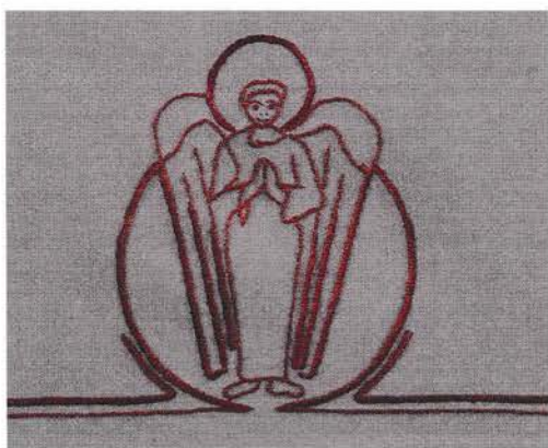
Bevinget menneske. Symbol for evangelisten Matthæus.