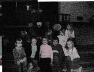
◀ Hellig Tre Kongers dukke omgivet af glade børn.