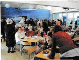
▲ Adventsmarked. Cafeteria.