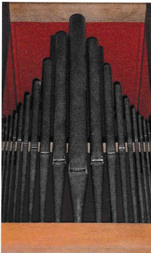
Nærbillede af Dyssegårdskirkens orgels frontparti.

Med forbehold for ændringer ser afviklingsplanen således ud: