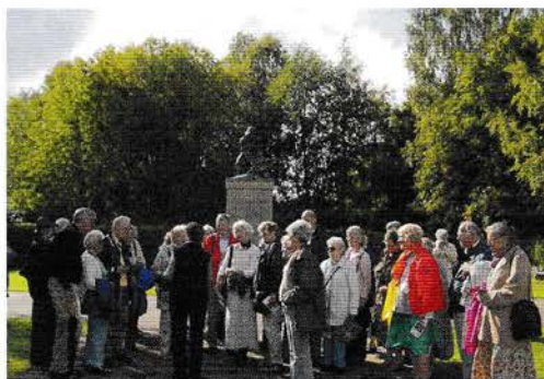
Turdeltageme ▶ i Rottneros Park.