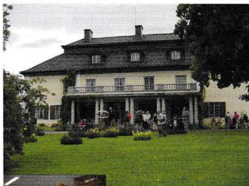
▲ Selma Lagerlöfs hus i Märbacka