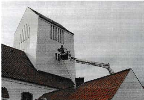
▲ Lynnedslag i Dyssegårdskirken. Fredag den 27. august 2004. Gentofte Brandvæsen slukker en mindre brand i kirketårnet. Der skete skader for over kr. 300.000.