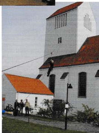
Dyssemarked 2004. ▶ FDF'erne havde bygget en svævebane til kirkens tårn.