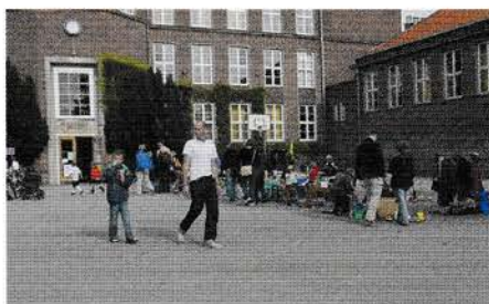
◀ Dyssemarked i Dyssegårdsskolens gård.