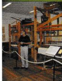
◀ Klässbols Linnevæveri